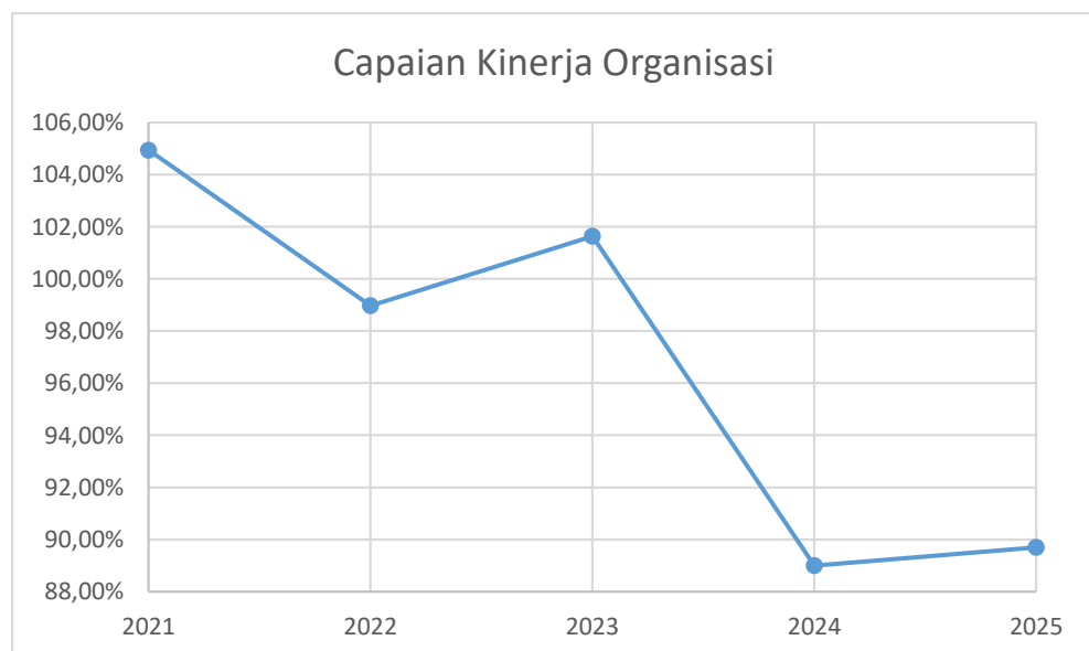
Gambar 3.1. Grafik Capaian Kinerja Organisasi Dari Tahun Ke Tahun Dinas Kependudukan dan Pencatatan Sipil Kabupaten Jombang