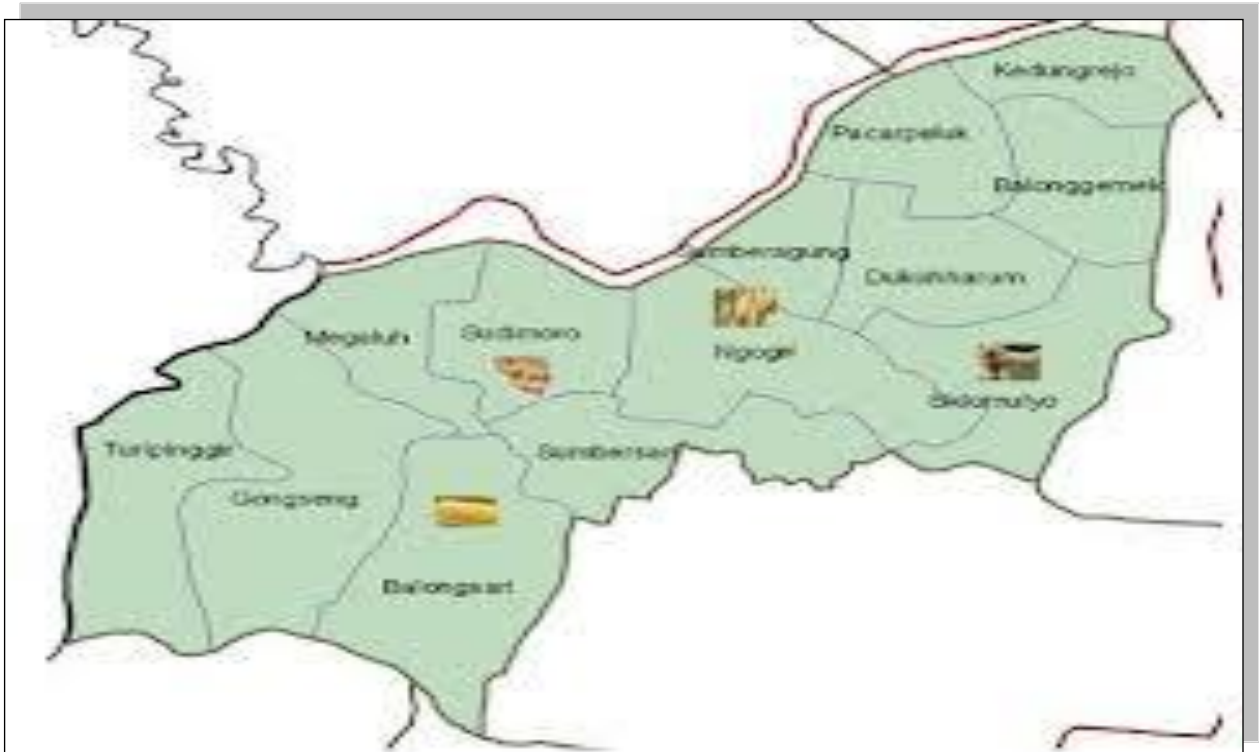
Peta Wilayah Kecamatan Megaluh