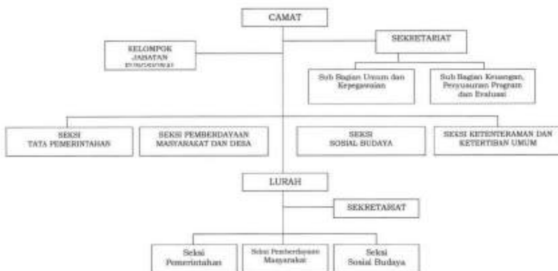
Gambar 2.1 Struktur Organisasi Kecamatan

Sumber Data: Peraturan Bupati Jombang Nomor 45 Tahun 2019