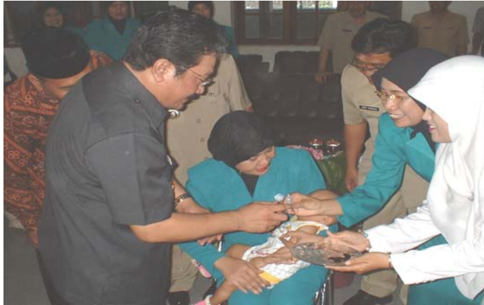
Bupati Jombang, H. Suyanto, memberikan imunisasi polio pada pencaanangan Pekan Imunisasi Nasional 2005

PD3I merupakan penyakit yang diharapkan dapat diberantas/ditekan dengan pelaksanaan program imunisasi, pada profil kesehatan ini akan dibahas penyakit tetanus neonatorum, campak, difteri, pertusis dan hepatitis B